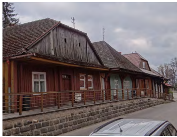
Drewniana zabudowa w Zakliczynie

0,0 A Zakliczyn – startujemy z rynku. Cechą charakterystyczną tego klimatycznego miasteczka, która przez wieki nadawała mu oryginalny charakter, jest zabudowa w postaci drewnianych, parterowych domów o specyficznej konstrukcji „dziewięciosłupowej”. Budynki stawiano szczytami do drogi, zwieńczone są dachami naczółkowymi, z okapami wydatnie wysuniętymi nad chodniki.