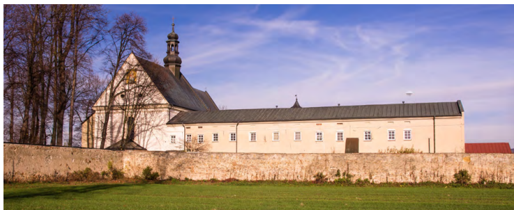
Zakliczyn, klasztor Franciszkanów

26,0 F Zakliczyn, klasztor Franciszkanów – zespół klasztorny w stylu barokowym wybudowano w latach 1641–1650 z fundacji ówczesnego właściciela Zygmunta Tarły. Wyposażenie wnętrza kościoła pochodzi z XVII–XIX w. Na uwagę zasługują także otoczenie klasztoru. Na dziedzińcu mieści się grota Matki Bożej z Lourdes usytuowana w otoczeniu pomnikowych lip drobnolistnych.