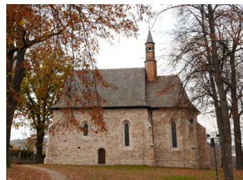
Kościółek św. Zofii w Bobowej

0,0 A Bobowa. Niewielkie miasteczko położone nad Białą, na skraju Pogórza Ciężkowickiego. Wycieczkę rozpoczniemy od centrum miejscowości. Na północ od rynku znajduje się kościółek św. Zofii wybudowany z kamienia w XV wieku. W jego bryle zachowało się wiele typowych detali dla architektury gotyckiej. Najcenniejszym jest ostrołukowy portal zachodni, umieszczony w schodkowym obramieniu. Bobowa była niegdyś znana z tradycji koronkarskiej . Piękne, unikatowe dzieła bobowskich koronkarek obejrzeć można w Galerii Koronek Klockowych w sali Centrum Kultury i Promocji Gminy w Bobowej (ul. Grunwaldzka 18).