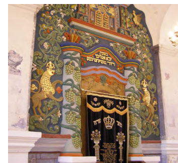
Wnętrze synagogi w Bobowej

Do II wojny światowej Bobową zamieszkiwała liczna społeczność żydowska. Miasto było szeroko znanym ośrodkiem chasydyzmu. Przy ul. Żydowskiej mieści się synagoga z 1756 r., odremontowana na początku XXI w. Wewnątrz uwagę zwraca polichromia oraz uznawana za jedną z najwspanialszych w Polsce oprawa ha-kodeszu (szafy ołtarzowej). W 1993 r. Synagoga została odzyskana przez Gminę Wyznaniową Żydowską w Krakowie. Obecnie sporadycznie odbywają się w niej nabożeństwa, zwłaszcza w obecności pielgrzymujących tu chasydów z różnych stron świata.