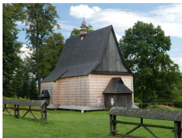
Siemiechów, kościół MB Gromnicznej

15,6 C Siemiechów, kościół pw. Matki Bożej Gromnicznej – drewniana świątynia w stylu późnego gotyku, z początku XVI w. W XX stuleciu dobudowano do niej murowaną kaplicę. We wnętrzu